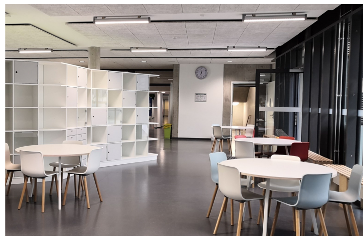
Schöne neue Pausenhalle in Niendorf, z.Z. kaum genutzt.

Ich glaube, wir Lehrerinnen und Lehrer können viel dazu beitragen, dass Schule in Zeiten von Corona ein guter und besonders wichtiger Ort ist. Ein Ort der Stabilität und Zuwendung. Wenn wir unseren Schüler*innen zuhören, mit ihnen sprechen, spielen und lachen, helfen wir Ihnen und uns, durch diese Krise zu kommen.