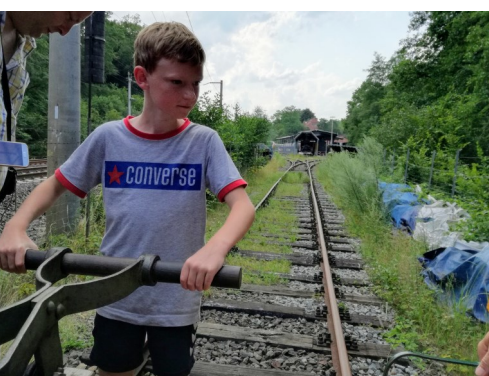
Lernen am anderen Ort

Außerschulische Hilfesysteme müssen gezielt aufrechterhalten/ausgebaut werden.