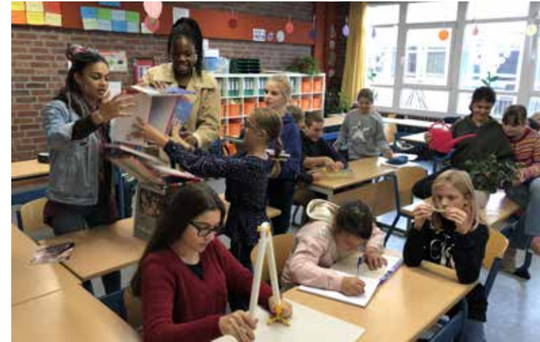
SchülerInnen engagieren sich im Projekt "Kunst" |

In drei von unseren sechs Jahrgängen wurden bereits Mehrklassen gebildet, sodass wir „auf kaltem Wege“ zur Fünfüzigkeit gelangen – allerdings ohne die entsprechende räumliche Ausstattung und ohne die notwendi-