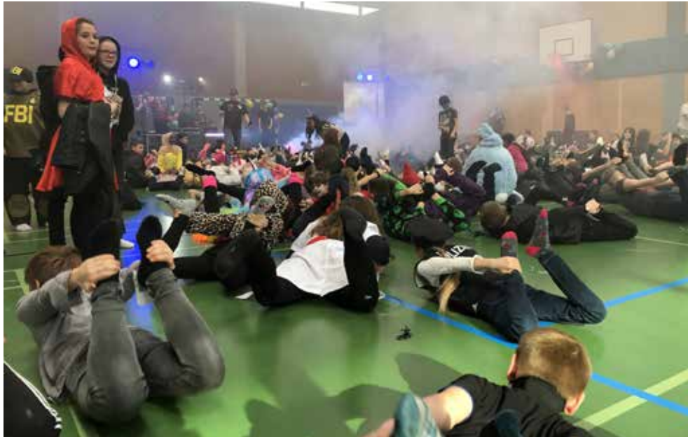
Spiel und Spaß in der Sporthalle