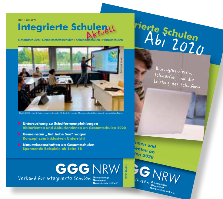
Titelseite ISA III 2020 und Deckblatt der Sonderseiten Abi 2020 in ISA IV 2020

Die Aktualität ist leider auch ein Anzeichen dafür, wie langwierig und schwierig Veränderungsprozesse im deutschen Bildungsbereich sind. Obwohl das deutsche Schulwesen u. a. durch Abschlungen und Klassenwiederholungen viele Einzelschicksale produziert und auf der gesellschaftlichen Ebene ineffektiv ist, bleibt es erhalten, weil es soziale Privilegien einer Minderheit sichert. ◀