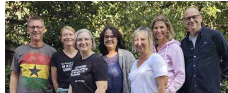
Schulleitungs- team der Rupert-Neudeck- Gesamtschule Tönisvorst