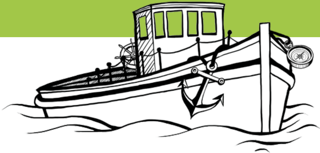
Illustrationen Bettina Eschweiler

tationen der Schüler_innen sowie Methoden, die nur im Plenum möglich sind, finden hier Raum.