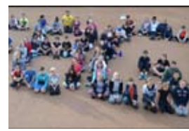
Foto oben: Israel-Austausch 2017, Kunstprojekt