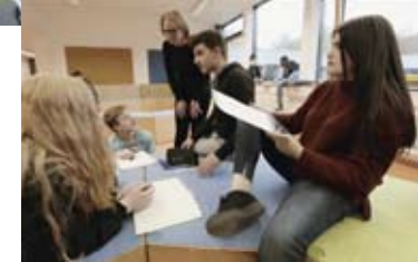
Architektur der Cluster

nannten „Cluster“. Sie beherbergen als eigenen (Brandschutz-) Abschnitt: