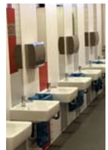
Schultoiletten zum „schönen Örtchen“