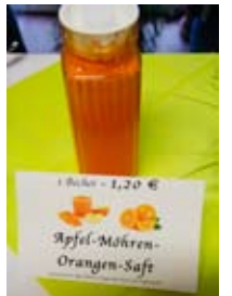
Die Mitglieder produzieren und verkaufen die leckeren Smoothies