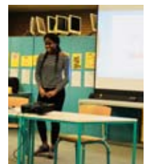
Mitglieder der Schüलगenossenschaft präsentieren ihre Firma auf der Gründungsveranstaltung