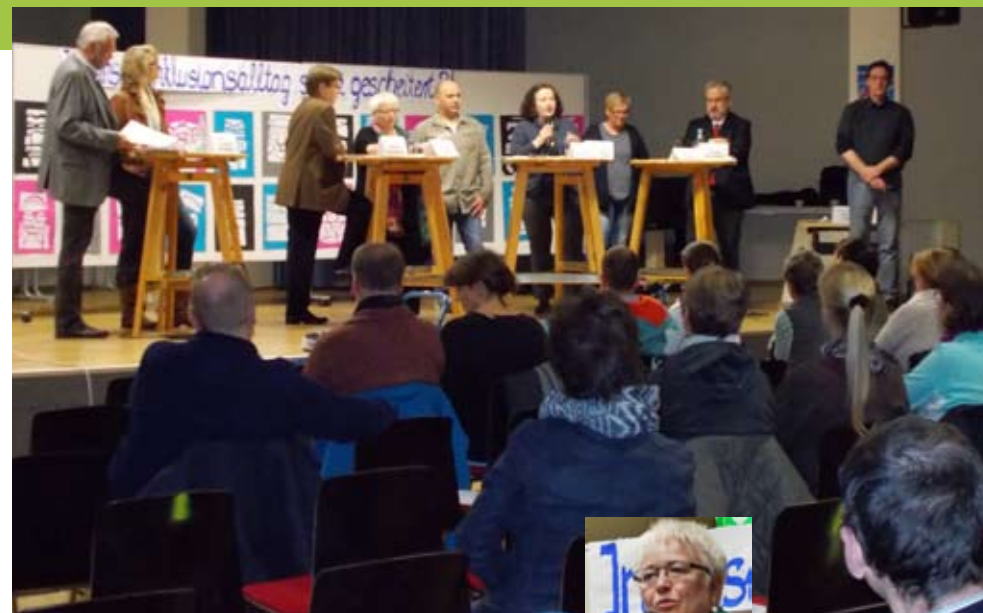
Fotos: Mathias Deger, Gesamtschule Marienheide Podiumsdiskussion, 9.3.2017

* Lernen, emotionale und soziale Entwicklung und Sprache