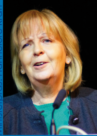
Ministerpräsidentin Hannelore Kraft