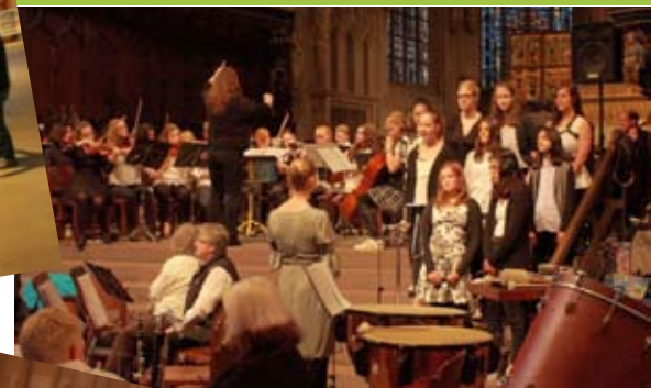
Das diesjährige Konzert der Gesamtschule Gartenstadt in der Reinoldikirche Dortmund mit dem Titel „Soundscapes“ war ein ganz besonderes Konzert für alle Teilnehmer.