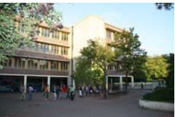
Gesamtschule Duisburg-Mitte an zwei Stand- orten

sonderpädagogischen Förderbedarf (7LE,2ES,2KM,1GG,3ES/LE,2SQ) für den 5. Jahrgang des Schuljahres 2018/2019 zugewiesen worden. Bisher hatten wir in erster Linie ES Schüler oder Schüler mit Autismus. Diese Schüler wurden zielgleich unterrichtet. Der neuen Zuteilung können wir in keiner Weise gerecht werden, insbesondere unter dem Gesichtspunkt der zieldifferenten Beschulung und „Benotung“. Gerade für diese Schüler ist die räumliche Ausstattung völlig unzureichend. An jeder Abteilung wurde in Eigenarbeit ein Auszeitraum eingerichtet, um einen möglichen Rückzugsort für die Schüler zu schaffen, da die Enge in den Klassenräumen leider oft Konfliktsituationen fördert, die bei mehr Bewegungszeit nicht auftreten würden.