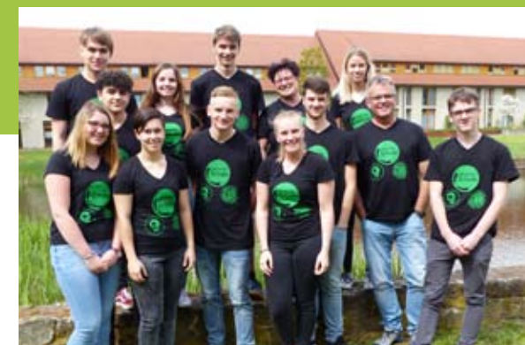
Teilnehmer des Treffens im Kloster Helfta

Die Gesamtschule Niederzier/Merzenich hat sich auf den Weg gemacht. Sicherlich gibt es im Schulalltag immer mal wieder Verhaltensweisen, die gegen das Schulethos verstoßen, doch wird die Idee eines gemeinsamen Ethos immer mehr gelebt und wird zu einem tragenden Element des Schulklimas. Immer mehr SchülerInnen, LehrerInnen und Eltern setzen sich ein und schauen nicht weg. Wir hoffen, dass unser Schulethos keine Utopie bleibt, sondern als