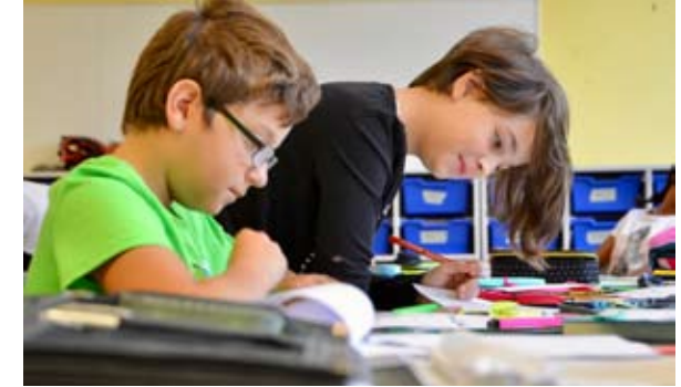
Lernen - drinnen und draußen

Ihre soziale Kompetenz können die Schüler u.a. im „Sozialpraktikum“ in der Jahrgangsstufe 11 weiterentwickeln: Sie arbeiten für zwei Wochen in sozialen Einrichtungen und lernen soziale Berufe kennen. In der sich anschließenden Praktikumsbörse erzählen sie von bewegenden Erfahrungen z.B. in Kindertagesstätten und Altenheimen. Wer gerne in Rollen schlüpft, kann im Fach „Darstellen und Gestalten“ Theater spielen lernen und bei einer