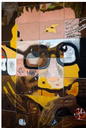
Der Namensgeber ist uns Verpflichtung

Bertolt Brecht, der aus Nazi-Deutschland geflohene Dichter und Dramatiker, ist ein passender Namensgeber für eine Schule in Vielfalt. In der Zeit seines Exils wechselte er häufiger die Länder als seine Schuhe, wie er in seinem bewegenden Gedicht „An die Nachgeborenen“ schreibt. Er schrieb in finsternen Zeiten für bessere Zeiten. Der Dichter lobte das lebenslange Lernen als Ausweg aus Armut und Ausgrenzung. Das Werk und die schillernde Persönlichkeit Bertolt Brechts und seiner couragierten Frau Helene Weigel geben der