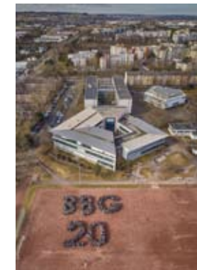
20 Jahre Bertolt-Brecht-Gesamtschule in Bonn

Doch Fordern und Fördern ist nicht nur das Motto für die Klassen des Gemeinsamen Lernens. Auch in den anderen Klassen sind die Lernvoraussetzungen sehr unterschiedlich. Das ist der Grund dafür, dass seit vier Jahren „SEGELN“ auf dem Stundenplan steht. Dabei ist Segeln eigentlich kein Fach, sondern ein Lernkonzept: SEGELN steht für Selbstgesteuertes Lernen. Damit geben die Lehrer eine Antwort auf drängende Fragen: „Wie schaffen wir eine Lernkultur, die Schüler individuell fördert, ihre unterschiedlichen Lernausgangslagen berücksichtigt, die besonders begabte Schüler fördert? Wie können benachteiligte Schüler, die zuhause weniger unterstützt werden, das Lernen lernen?“ Gemeinsam entwickelten Lehrer Strukturen für eine Lernzeit, in der die Schüler selbstständig und differenziert lernen und üben können. Die Lehrer sind im SEGELN Beobachter und Berater der Schüler; Klassenräume sind flexibel auf die Lernzeiten angepasst worden und regen in ihrer Gestaltung das Arbeiten der Kinder an.