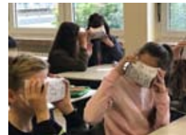
oben: Gewässeruntersuchung Mitte: 3D-Drucker im Einsatz unten: Google Expedition mit VR-Brille