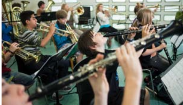
Musik liegt in der Luft