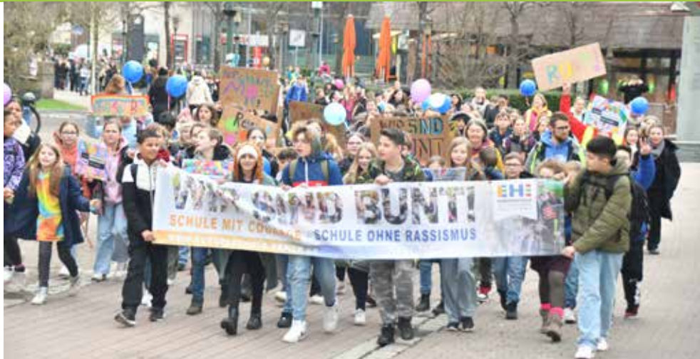
Schüler und Schülerinnen der teilnehmenden Schulen beim Sternlauf.