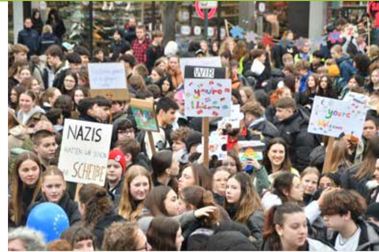
Plakate mit eindeutigen Botschaften wurden während des Sternlaufs und der Kundgebung am Neuen Markt hochgehalten.

Schon der Sternlauf mit Polizeibegleitung von den jeweiligen Schulen aus über die Straßen in die Stadtmitte war beeindruckend. Viele Jugendliche trugen Banner durch die Stadt, hielten Plakate mit eindeutigen Botschaften gegen Rechts hoch und waren nicht zu überhören: „Wir sind bunt“ tönte es aus der Masse. Am