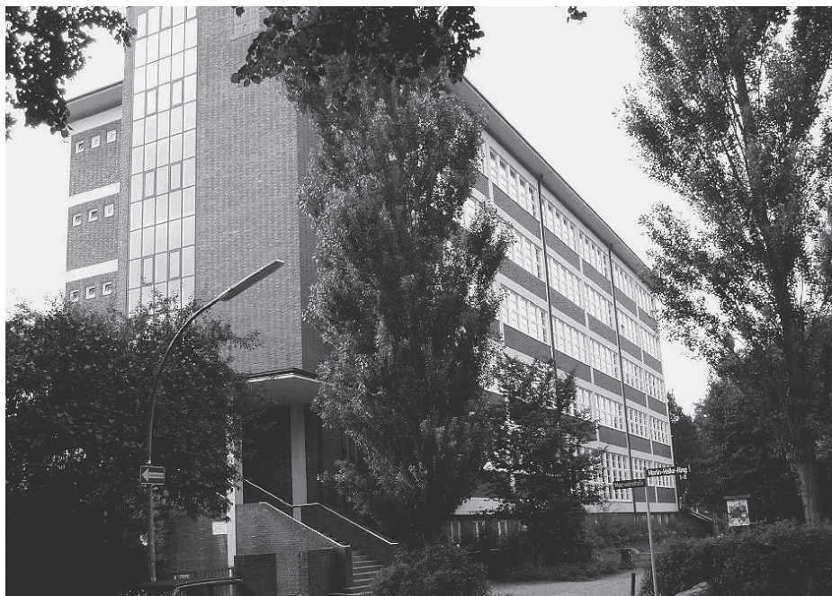
Das Hauptgebäude der Gesamtschule Winterhude

Schule oder woanders erworben haben. Ein woanders erworbenes Können muss dann nicht mehr an der dafür vorgesehenen Stelle in der Schule erarbeitet werden. Die Eltern sind gehalten, das Logbuch regelmäßig anzuschauen und zu unterschreiben.