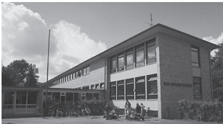
Die Max-Brauer-Schule in Hamburg, Trägerin des Deutschen Schulpreises 2006

lass nehmen, uns wieder international umzusehen. Deshalb haben wir Experten aus Finnland, Schweden, Dänemark, Südtirol und Polen eingeladen, um uns von ihnen über die aktuelle schulpolitische Situation und Entwicklung in ihren Ländern berichten zu lassen (am Sonnabend Vormittag alternativ zu den Workshops); es besteht Gelegenheit zur Nachfrage und Diskussion. Der bildungspolitische Aussage des Bundeskongresses wird dann im Rahmen unserer Hauptveranstaltung (am Sonnabend