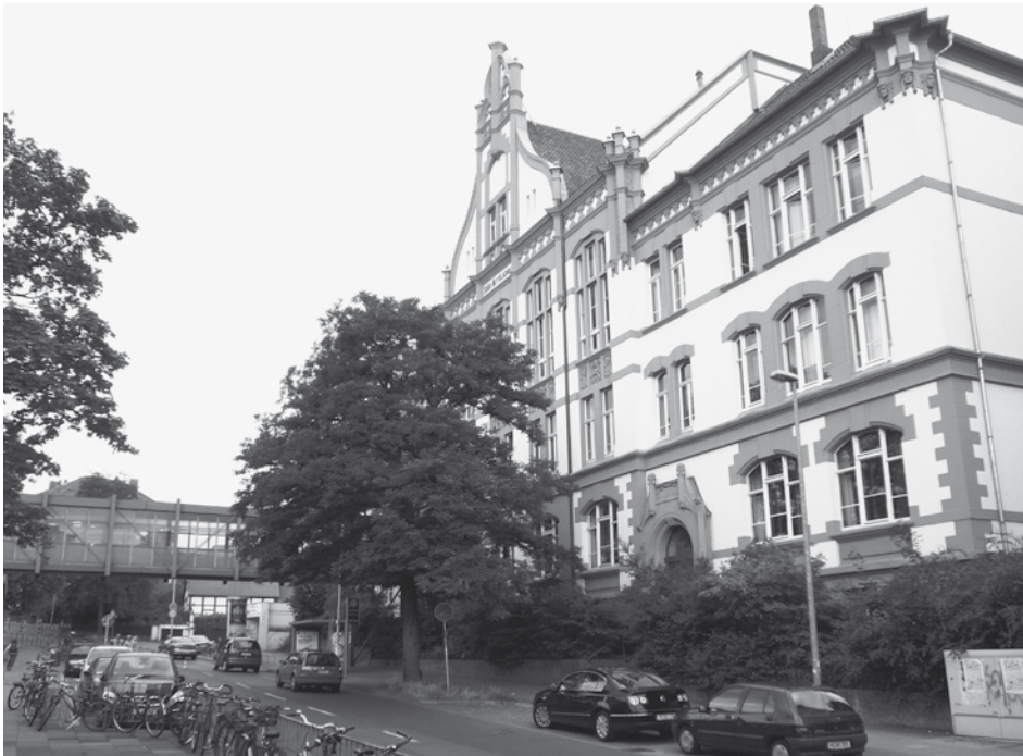
IGS Linden Hannover

Wochenplan und Freiarbeit: Für die Erledigung von wöchentlich 3 bis 6 Arbeitsaufträgen stehen 3 Wochenstunden zur Verfügung. Die Schwierigkeit der Aufgaben ist dem unterschiedlichen Leistungsstand der Schüler/innen angepasst. Jede/r Schüler/in entscheidet über die Art der Erledigung der Aufträge selbst. Neben den Pflichtaufträgen können die Schüler/innen selbst gewählten Tätigkeiten nachgehen: Bücher lesen, Übungskarteien bearbeiten oder Arbeit an freien Vorhaben. Studierende stehen als Unterrichtsleiter zur Verfügung.