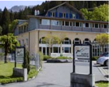
Institut Beatenberg in der Schweiz