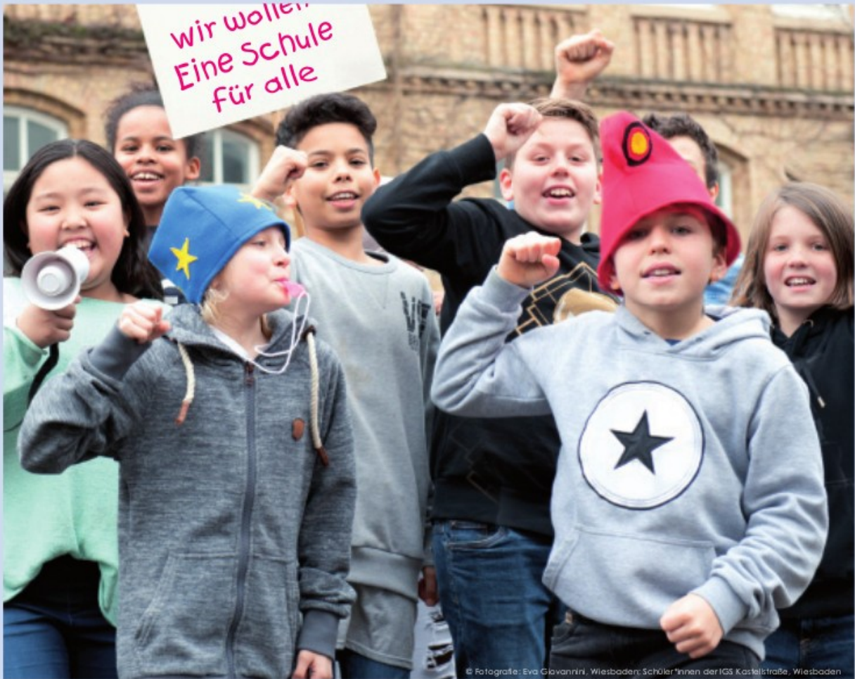
© Fotografie: Eva Giovannini, Wiesbaden: Schüler*innen der IGS Kastelstraße, Wiesbaden