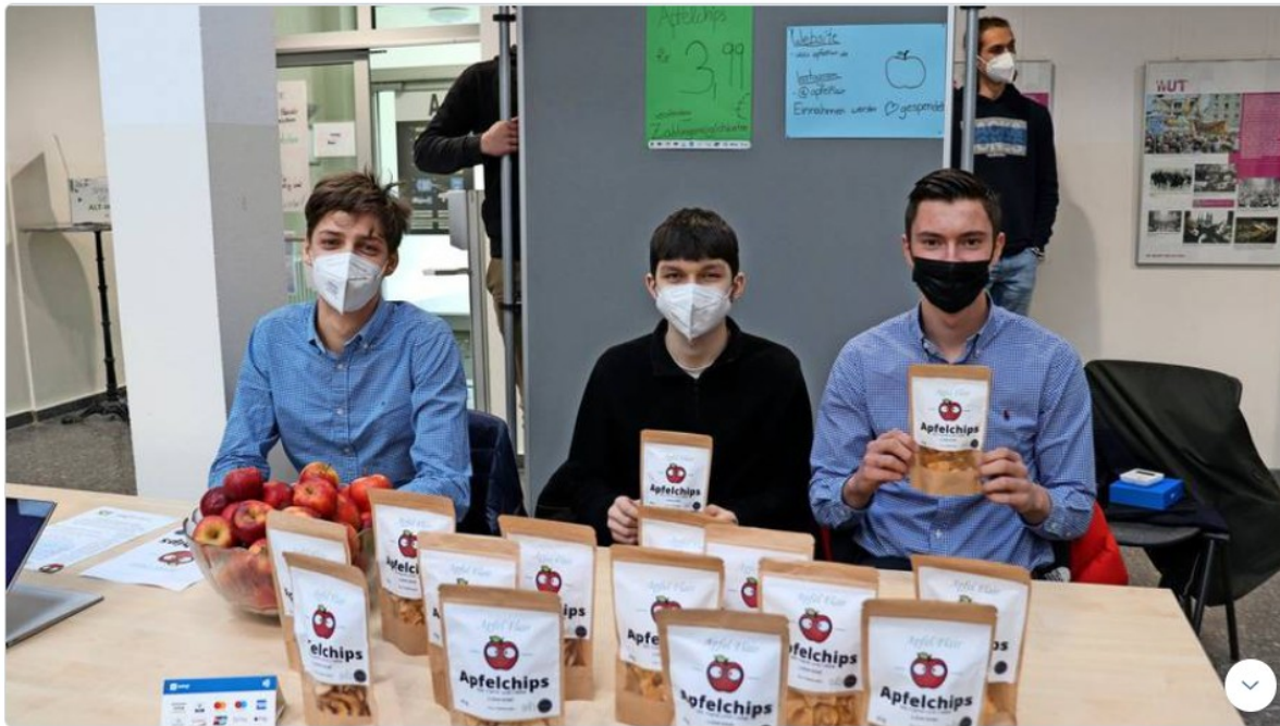
Schüler entwickeln Start-Up für Apfelchips