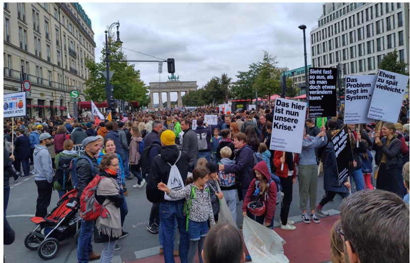
Fridays for Future demonstrierten am 20.9.2019 in Berlin am Brandenburger Tor. Kongressteilnehmer*innen beteiligten sich daran und unterstützten FfF mit einer Spende

Das öffentliche Schulwesen muss seinem Auftrag der bestmöglichen Potenzialentfaltung für jedes Kind gerecht werden und gleichermaßen ein wertschätzendes, demokratisches Miteinander beim gemeinsamen Lernen in einer Schule für alle erlebbar machen. Nur so kann die Zukunft gewonnen werden.