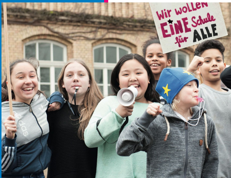
Fotomotiv: Schüler*innen der IGS Kastellstraße, Wiesbaden