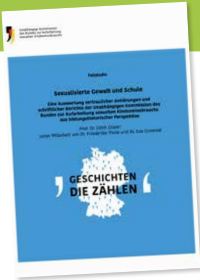
Deckblatt der Fallstudie