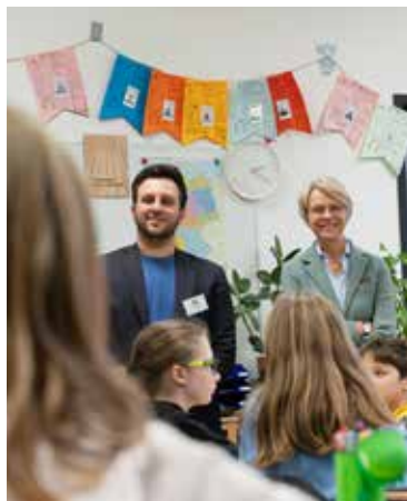
Bild links + rechts unten: Lesetraining im Jahrgang 5, Ministerin Feller im fachlichen Austausch mit Kathrin van Emmerich

Bild links: Liam Boyd, Initiator der Einladung (ganz rechts), eine Delegation aus der Schulgemeinde, Vertreter und Vertreterinnen aus der Politik und Schulaufsicht, heißen Ministerin Feller willkommen Bild rechts: aus unserem Demokratie-konzept