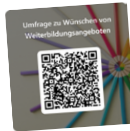
Umfrage zu Wünschen von Weiterbildungsangeboten

Wir freuen uns auf Feedback und über die Teilnahme an unserer Umfrage zu schulischen, funktionsbezogenen und/oder persönlichen Wünschen zu Weiterbildungsangeboten.